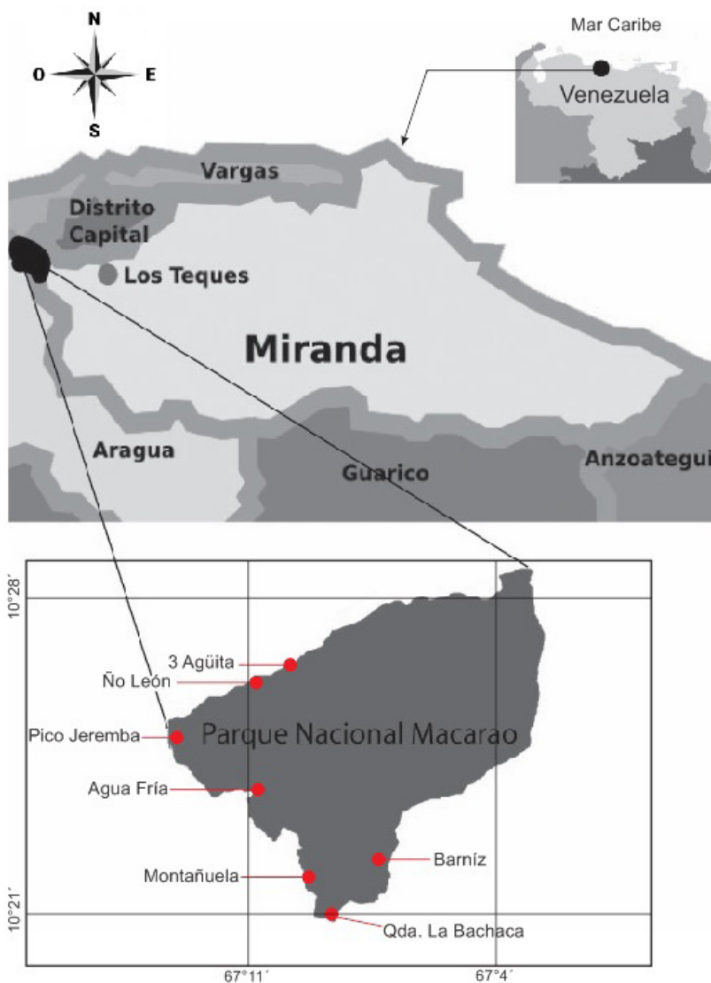
Figura 1: Ubicación geográfica del Parque Nacional Macarao, Venezuela, y las siete localidades de muestreo indicados con un círculo rojo. Se detalla toda la región de la Cordillera de la costa venezolana con sus límites geográficos como son los estados Guarico y Anzoategui.

m), se encontró una fuerte intervención antropogénica que imposibilitó el muestreo en esa zona.