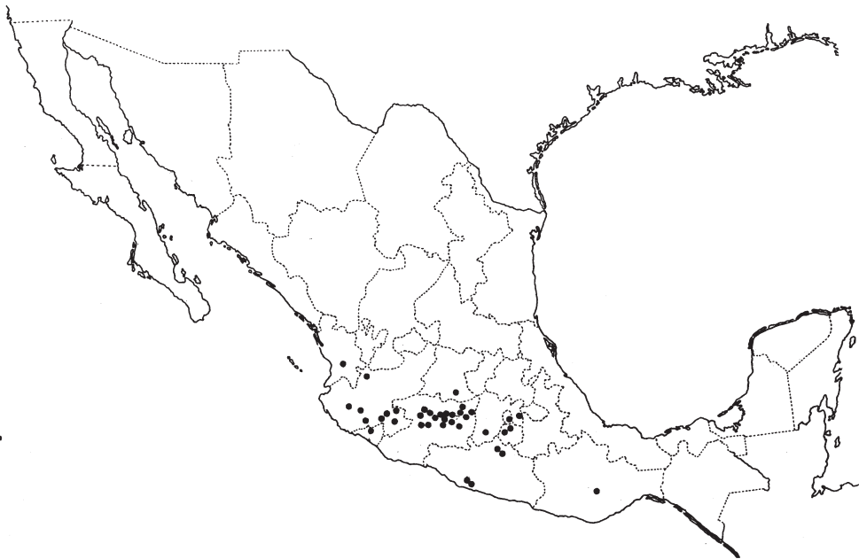
Fig. 2. Distribución geográfica conocida de Symplocos citrea Lex.

En Michoacán la madera de S. citrea se usa en la elaboración de cucharas y muebles chicos y el fruto se registra como comestible.